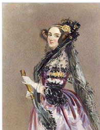
Ada Lovelace (1840).