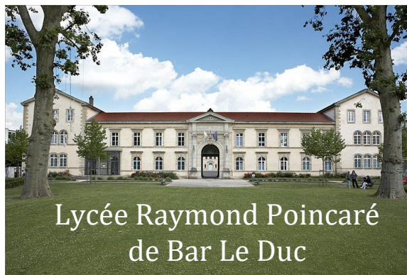
Lycée Raymond Poincaré de Bar Le Duc