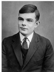
Alan Turing à l'âge de 16 ans.

L'objectif de cet enseignement est l'appropriation des concepts et des méthodes qui fondent l'informatique, dans ses dimensions scientifiques et techniques. Cet enseignement s'appuie sur l'universalité de quatre concepts fondamentaux et la variété de leurs interactions : les données, les algorithmes, les langages et les machines.